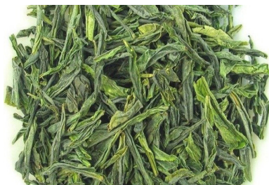
Lu An Gua Pian