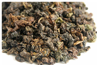
Formosa GABA Oolong