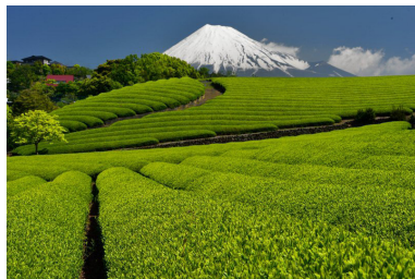
Čajová plantáž v Japonsku