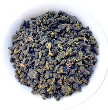
Formosa Ren Shen