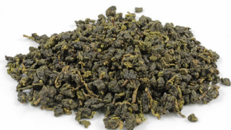
Jin Xuan Nai Xiang