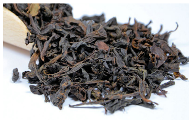
Da Hong Pao