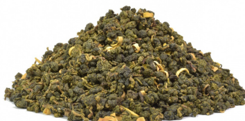
Orange Flower Oolong