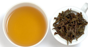
Mi Lan Xiang Dan Cong