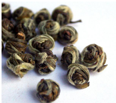
Tian Mu Long Zhu Cha